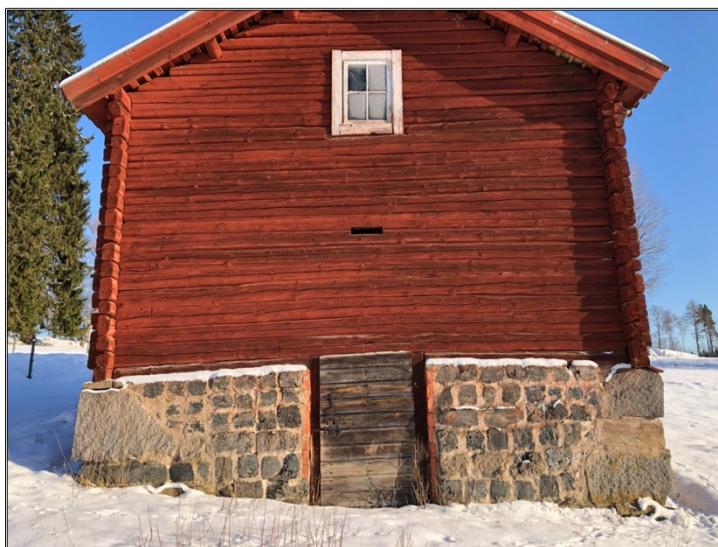
En ekonomibyggnad på gården där man har murat upp grunden med slaggtegel.