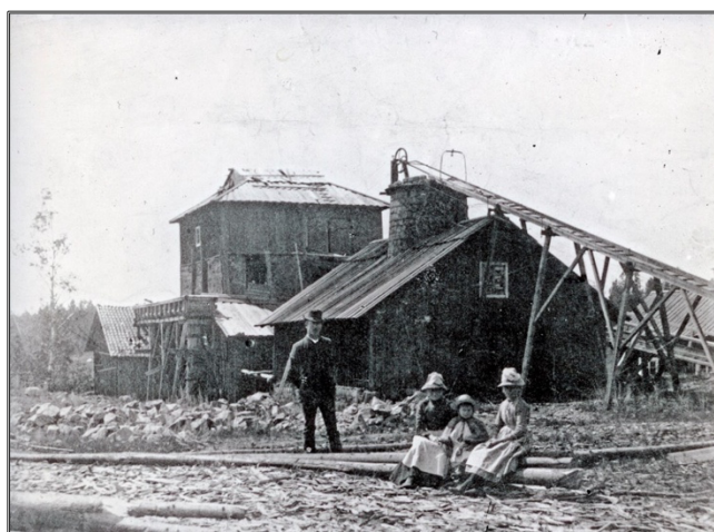
Bråfors hytta 1890-tal.

resten av ekonomibyggnaderna. Tidigare låg en manbyggnad mitt emot den nuvarande manbyggnaden, men revs på 1960-talet. Denna manbyggnad formade ett fyrkantigt gårdskomplex vilket kan hänföras till den centralsvenska gårdstypen (Erixon, 1930). Stora Bråfors innehar cirka 50 byggnader i sin bebyggelse. Söder om den mindre landsvägen finns det byggnader som främst kan kopplas till jordbruksdriften. En stor ladugård, flera lador och en tröskloge är ett tydligt spår från den omfattande förnyelsen av Stora Bråfors jordbruksdrift, då de flesta byggdes kring förra sekelskiftet (Stiftelsen Kulturmiljövård, 2015). Norr om vägen, ligger det en samlad bebyggelse kring det grusade gårdstunet som kan kopplas till gårdslivet, som till exempel loftbodnar, drängstuga, ladugårdar, logar, magasin, uthus och smedja. De flesta av ekonomibyggnaderna härrör från tidsperioden kring 1800-talet. I gårdens storhetsperiod runt 1800-talets mitt, byggdes även arbetarbostäder för de arbetare som jobbade i gårdens hytta. Tre bostäder byggdes ett stycke västerut, och norrut (Ibid).