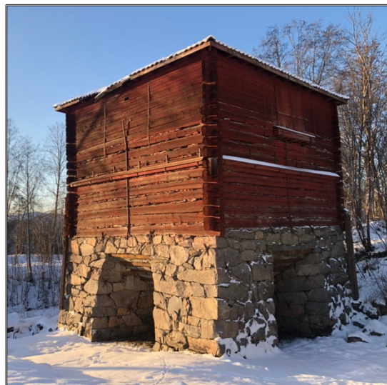
Landforsens masugn, Karbenning socken, Norberg.

Genom att äga gården fick bönderna privilegium att äga del i gruvor och hyttor. Eftersom järnhanteringen var landets viktigaste näring för ekonomin, så uppenbarades det även på bergsmännens gårdar (Backlund, 1988). Gårdarna hade en agrar karaktär, men representerade ändå en social miljö som låg mellan herrgårdarna och bondgårdarna (Hellspong och Löfgren, 1994). En avgränsning mellan bergsmännens gårdar och böndernas gårdar var viktig att hålla. Bergsmansgårdarna byggdes stort och ståtligt med vanligtvis två våningar och tillhörande flyglar med identisk typ på vardera sida om det grusade gårdstunet. Gårdarna byggdes ofta i en parstuguplan, med rödfärgade timmerfasader under 1700-talet. På den tiden var det ovanligt för bondgårdar att ha färglagda fasader. Under 1800-talet kom oljefärgen och de stående kilsågade panelerna till herrgårdarna, och bergsmännen var snabba att även applicera det på sina egna gårdar. Bergsmansgårdarna målades då i ljusa oljefärger för att ge uttryck för sin rikedom (Backlund, 1988). Karakteristiskt för bergsmansgårdarna var att man prydde skorstenarna med en krona av gjutjärn, detta visade att på gården bodde en välbärgad bergsman (Hellspong och Löfgren, 1994).